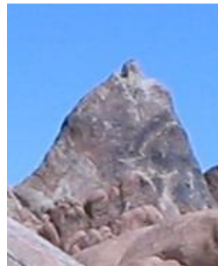
Ab dieser Stelle ist der markanteste Anhaltspunkt gut zu sehen. Hier ein größeres Bild davon: