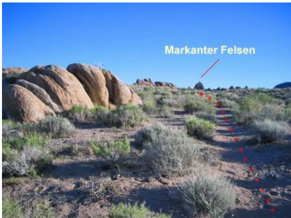
9. In Höhe dieser Felsen hat man dann diese Aussicht: In der entfernten Felsgruppe ist ein markanter Felsen, auf welchen man nun immer darauf zu läuft.