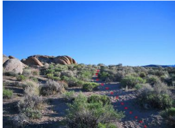
8. Hier sieht man die Felsgruppe aus etwas geringerer Entfernung. Der Trail führt sanft bergauf.