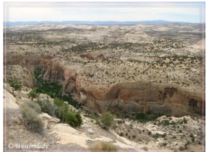
Die Schlucht des Calf Creek vom Hwy 12 aus betrachtet.

Bei den Info-Tafeln findet man ein Kästchen und kleine Briefumschläge, in welchen man den Fee eintütet und die dafür vorgesehene Box wirft. Der Abriss am Kuvert kommt sichtbar auf das Amaturenbrett.