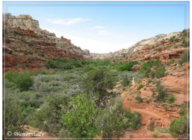
Und Blick nach Süden.

In der Schlucht findet man nur am frühen Vormittag etwas Schatten oder an den wenigen Stellen, wo der Trail zwischen ein paar Bäumen verläuft. Vor allem während der ersten Hälfte des Trails sind schattige Stellen sehr rar und im Canyon kann es sehr heiß werden.