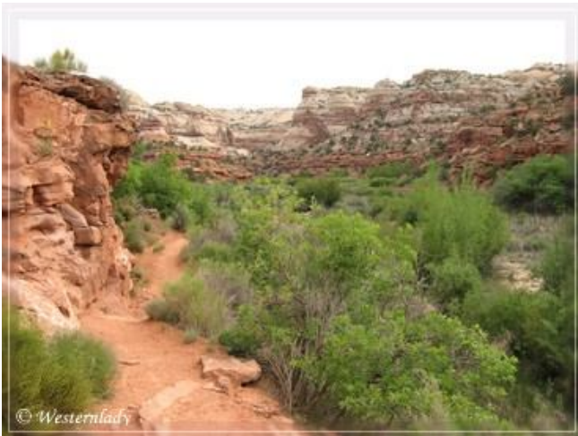
Im ersten Drittel des Trails: Blick nach Norden.

Der Trail führt an der Westseite des Canyons, etwas oberhalb des Calf Creek entlang.