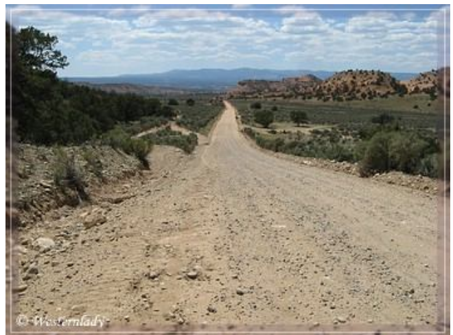
Die Cottonwood Canyon Road führt schnurgerade hinab in das Tal.