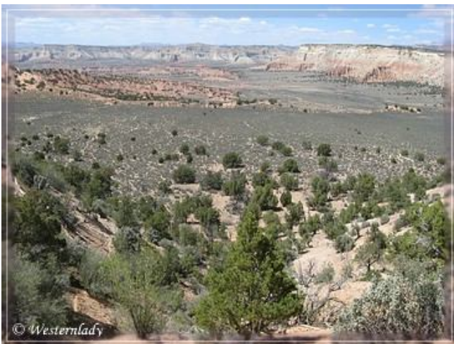
Blick in das Kodachrome Basin