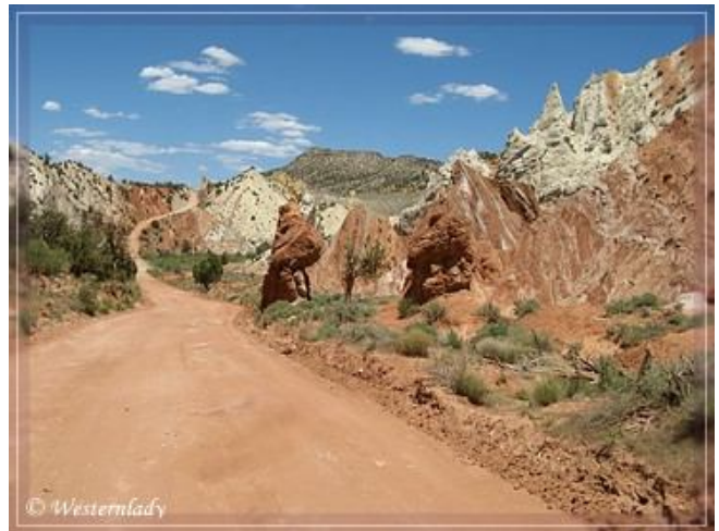
Der dramatischste Abschnitt der Strecke.

Die Cottonwood Canyon Road verläuft nun zwischen dem Cottonwood Creek und den farbigen Felsen des Cads Crotch im Osten. Zu den Rottönen mischen sich auch gelbe Felsformationen und bieten einen Vorgeschmack auf das nächste Highlight.