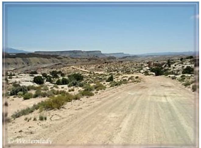
Blick nach Süden: im Osten (links) liegt das North Caineville Reef