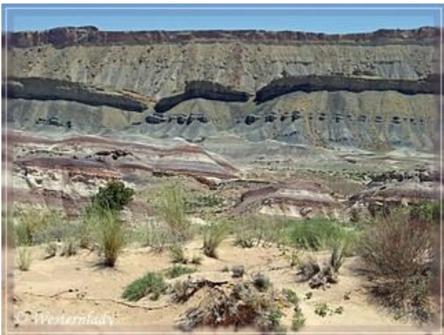
Die grauen Klippen und farbvollen Badlands vom North Caineville Reef

Während der ersten Meilen verläuft die Caineville Wash Road im Westen und parallel zum North Caineville Reef nach Norden. In diesem Bereich ist die Caineville Wash Road eine typische Staubstraße.